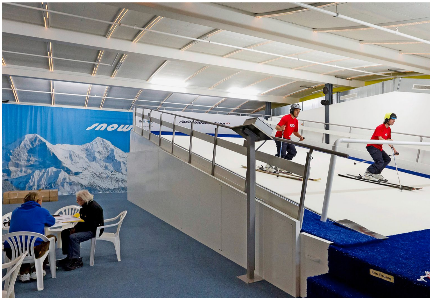
Einmal gab es auch in Interlaken eine Anlage: Zwei InstruktorInnen fahren 2012 Ski auf dem Indoor-Teppich. Die Anlage ist längst zu.

Allein der Skiteppich, der im Mai aus den Niederlanden kommen soll, wo bereits Dutzende solcher Hallen in Betrieb sind, kostet 200'000 Franken. Insgesamt brachten die sechs Gründer 300'000 Franken mit. Die Inbetriebnahme im Juni ist so gesichert.