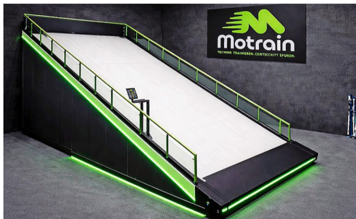
Das Herzstück der Anlage in Ennenda: Der Skiteppich, der bezüglich Steilheit und Winkel unterschiedlich eingestellt werden kann.

Zur Anlage sollen auch Toiletten, Garderoben mit Duschen und ein Aufwärmbereich mit einem speziellen Boden, Fitnessgeräten und Hanteln gehören. Für deren Finanzierung läuft derzeit ein Crowdfunding. Über die Hälfte des Wunschbetrags von 60'000 Franken ist schon zusammengekommen. Auch der Betrieb kostet Geld, zur Miete kommen Strom- und Wasserkosten sowie die Coaches, welche die Trainierenden für das Befahren des Teppichs schulen müssen. Die Betreiber sind derzeit auch mit möglichen Sponsoren im Gespräch.